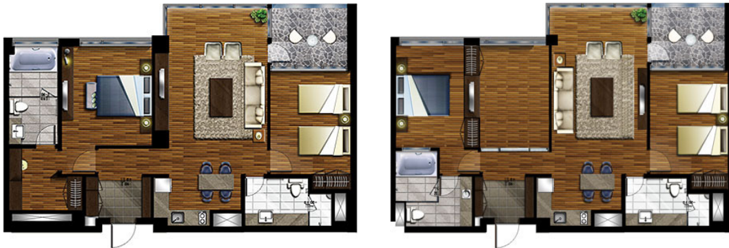
로얄스위트A(더블베드 + 트윈베드)