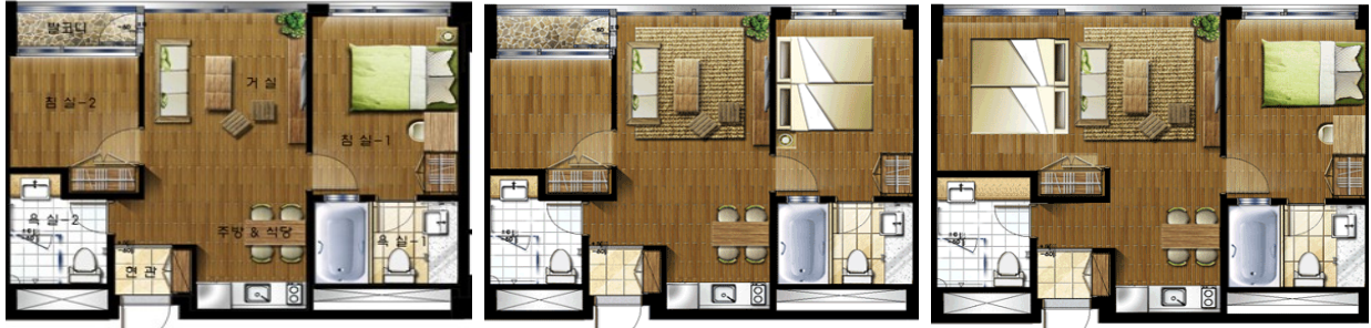
로얄더블온돌(더블베드 + 온돌방)